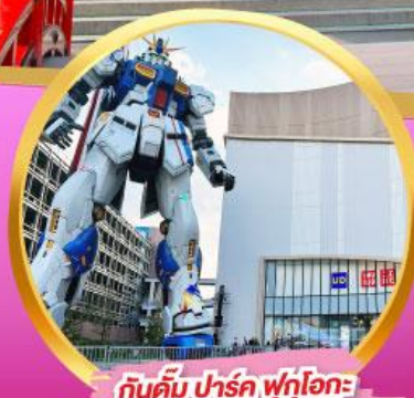
กันดั้ม ปาร์ค ฟุกุโอกะ