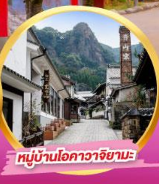
หมู่บ้านโอคาวาจิยามะ