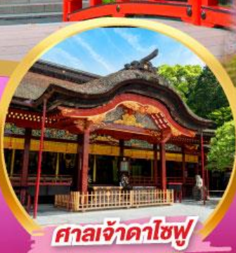
ศาลเจ้าดาไซฟุ