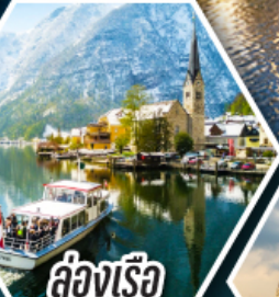
ล่องเรือ ทะเลสาบอัลสติก