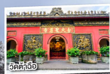
วัดตุ๊กฉือ