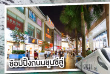
ช้อปปิ้งถนนชุนชี่