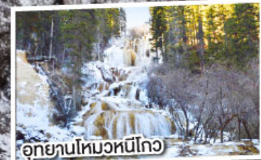
อุทยานโหมวหนีโกว