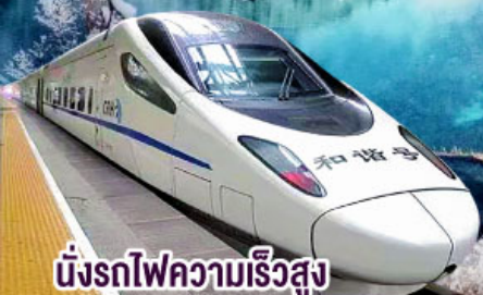
นั่งรถไฟความเร็วสูง