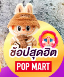
ช้อปปิ้งสุดฮิต POP MART