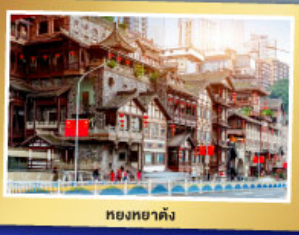
หยงหยาดิ่ง