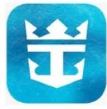
Royal Caribbean International App.