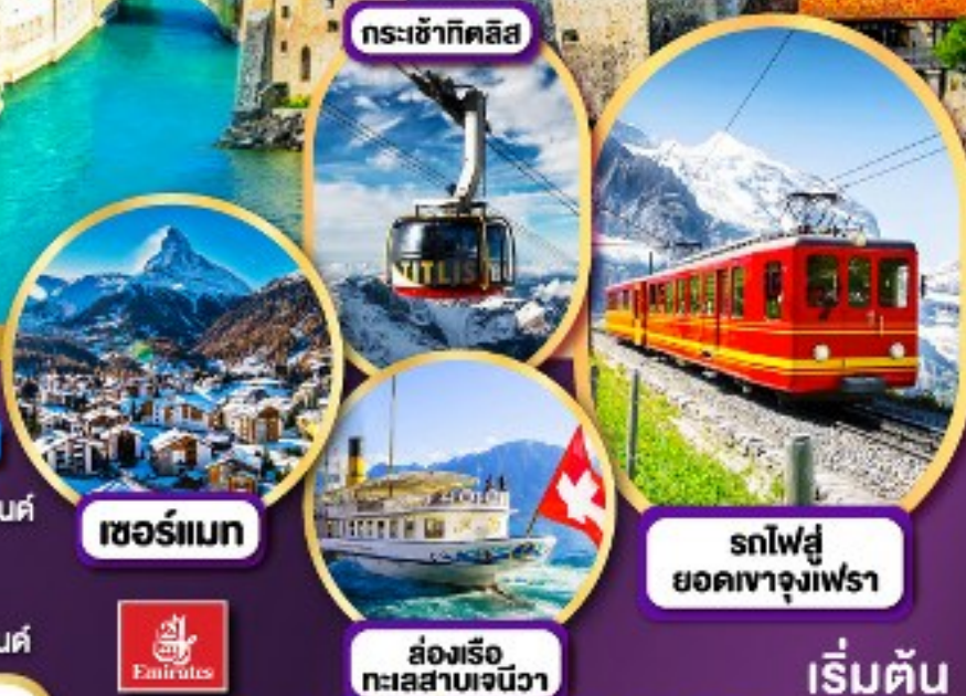
กระเช้ากิตลิส เซอร์แมท รถไฟสู่ยอดเขาจุงเฟรา ส่องเรือทะเลสาบเจนีวา