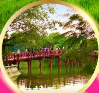
ทะเลสาบคินดาบ