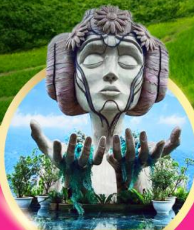
โมนาน่า ซาปา คาเฟ่