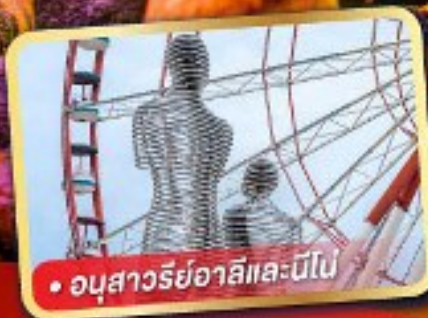
• อนุสาวรีย์อาลีและนีโอบี