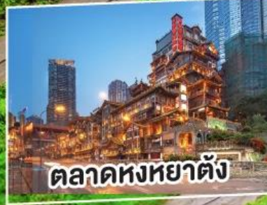
ตลาดหงหย่าตั้ง