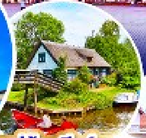
หมู่บ้านกีธูร์น