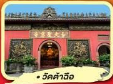
• วัดต้าวิ้อ