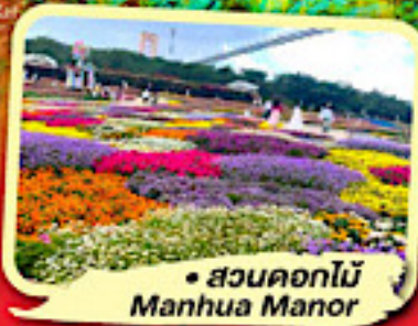
• สวนดอกไม้ Manhua Manor