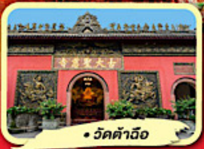
• วัดต้าอี้อ