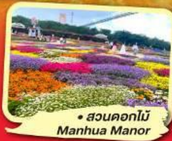
• สวนดอกไม้ Manhua Manor