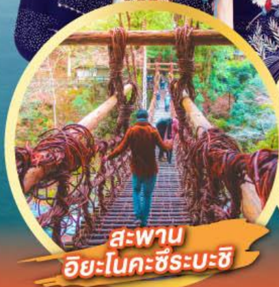
สะพาน อิยะโนะคะชิระบะชิ