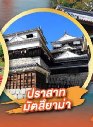
ปราสาท มัตสึยาม่า