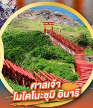
ศาลเจ้า โมโตโนะซุมิ อินาริ