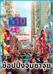
ช้อปปิ้งจิมซาฉุย