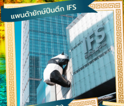
แลนด์มาร์กบีนตึก IFS