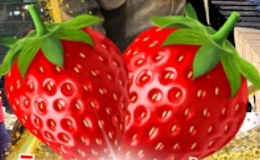
มีผลตอบเอบอจ้สุด ๆ จากรั้