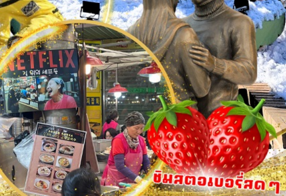
ตลาดกวางจง