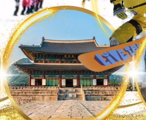
พระราชวังเคียงบกกุง