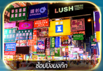
ช้อปปิ้งมณฑก

เต็มอิ่มทั้งบุญ และ ช้อปปิ้งแบบจัดเต็ม จิมซาจู้ย มงก๊ก