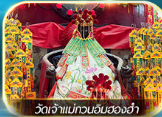
วัดเจ้าแม่ทวนอิมฮ่องกง