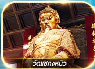
วัดเข็กงหมิว