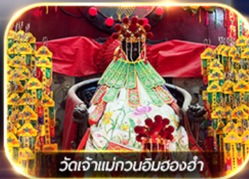
วัดเจ้าแม่กวนอิมสองอ่า