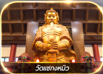
วัดเขangkหมิว