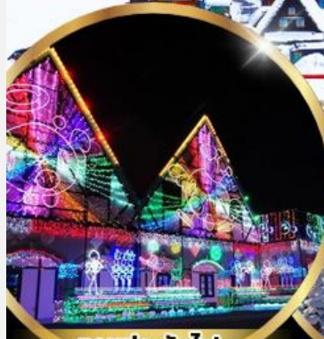
งานประดับไฟ Tokyo german village