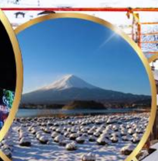
สวนโออิชิ พาร์ค