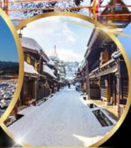
ตากายาม่า