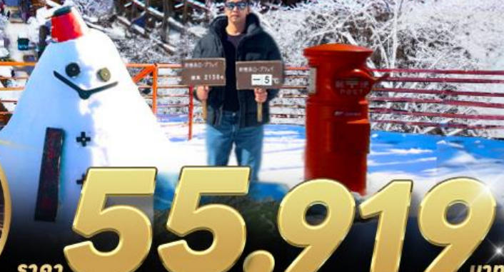
ทาคายาม่า