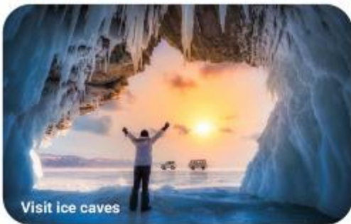
Visit ice caves