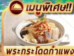
เมนูพิเศษ!! พระกระโดดกำแพง