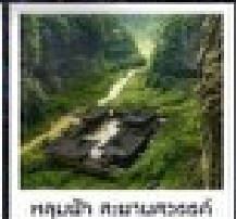
อุทยานแห่งชาติผิงผิง