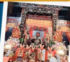
เทพเจ้ากวนอู วัดกวนไท่