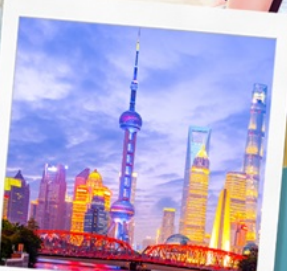
ทิวทัศน์