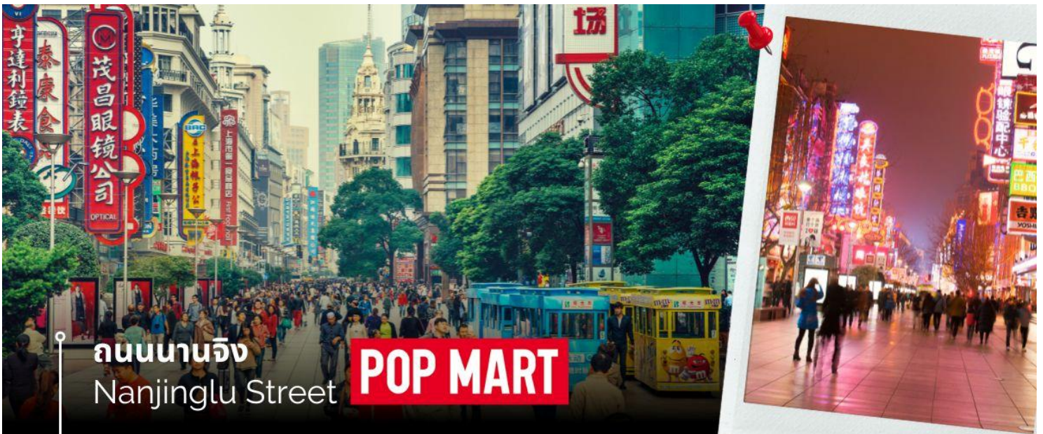
ถนนนานจิง Nanjinglu Street POP MART

นำท่านสู่บริเวณ หาดไว่ทาน ตั้งอยู่บนฝั่งตะวันตกของแม่น้ำหวงผู้มีความยาวจากเหนือจรดใต้ถึง 4 กิโลเมตรเป็นเขตสถาปัตยกรรมที่ได้ชื่อว่า “พิพิธภัณฑ์สิ่งก่อสร้างหินปูนแห่งชาตินจีน” ถือเป็นสัญลักษณ์ที่โดดเด่นของนครเชียงใหม่ ไฮ้ และนำท่านช้อปปิ้งย่าน ถนนนานจิง Nanjinglu Street ศูนย์กลางสำหรับการช้อปปิ้งที่คึกคักมากที่สุดของนครเชียงใหม่ ไฮ้ รวมทั้งห้างสรรพสินค้าใหญ่ชื่อดังกว่า 10 แห่ง และช้อปปิ้ง ร้าน POP MART สุดฮิตในขณะนี้เพื่อเป็นของฝากที่ระลึกให้แก่ญาติสนิทมิตรสหาย