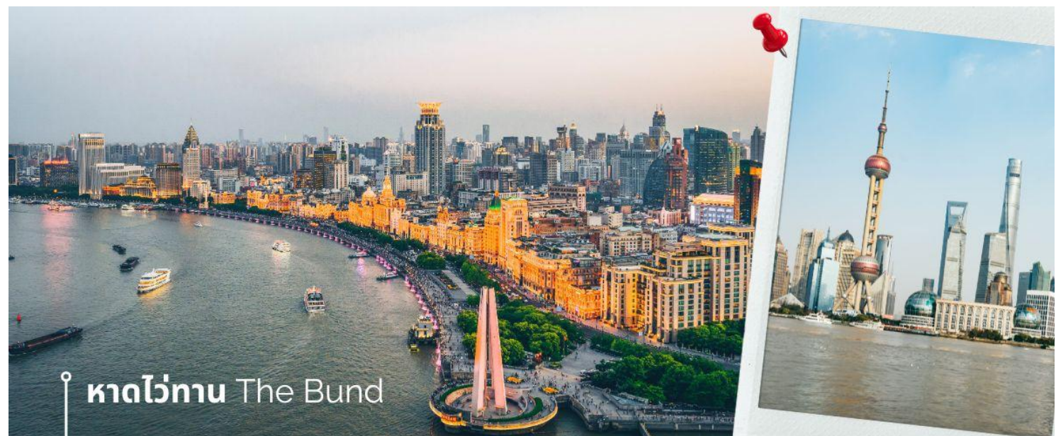
หาดไว่ทาน The Bund

จากนั้นนำท่านเดินทางสู่แลนด์มาร์คของเมืองเชียงใหม่ นักท่องเที่ยวทั้งชาวจีนและชาวต่างชาติ ต่างพากันมาถ่ายรูปอย่างไม่ขาดสาย เมื่อมาถึงเมืองเชียงใหม่ นั่นคือ หอไข่มุกตะวันออก Oriental Pearl Tower (ผ่านชม) เป็นหอส่งสัญญาณวิทยุโทรทัศน์สูง 468 เมตร ลักษณะเป็นไข่มุก 11 ลูก และ เสา 3 เสา ด้านบนเป็นรูปไข่มุก 3 เม็ด 3 ขนาดเรียงกันในแนวตั้ง