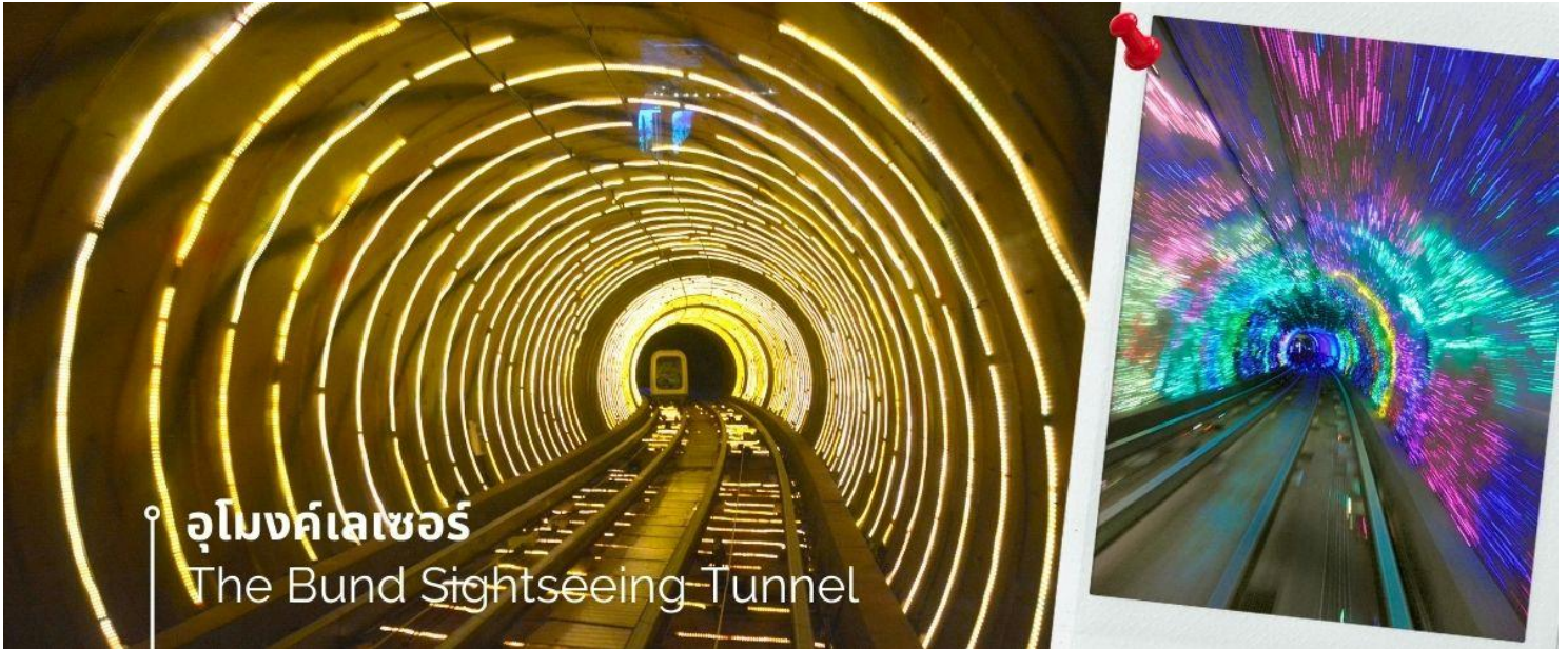
อุโมงค์เลเซอร์ The Bund Sightseeing Tunnel

จากนั้นนำท่านเปิดประสบการณ์ใหม่กับ The Bund Sightseeing Tunnel อุโมงค์เลเซอร์ เชียงไฮ้ ถูกสร้างขึ้นเพื่อให้ใช้เป็นเส้นทางขนส่งนักท่องเที่ยวกรุ๊ปใหญ่ๆ ที่มาเที่ยวที่นครเชียงใหม่ ไฮ้ ทางรถไฟได้ติดตั้งระบบแสงสีเสียงสุดอลังการภายในอุโมงค์แห่งนี้ ทำให้ช่วงเวลาระหว่างอยู่บนรถอัตโนมัติภายใต้อุโมงค์แห่งนี้ เหมือนอยู่ในอีกโลกหนึ่ง