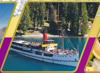
ล่องเรือกลไฟโบราณ อาหารแบบ BBQ ที่ออลเตอร์พ็อด ฟาร์ม