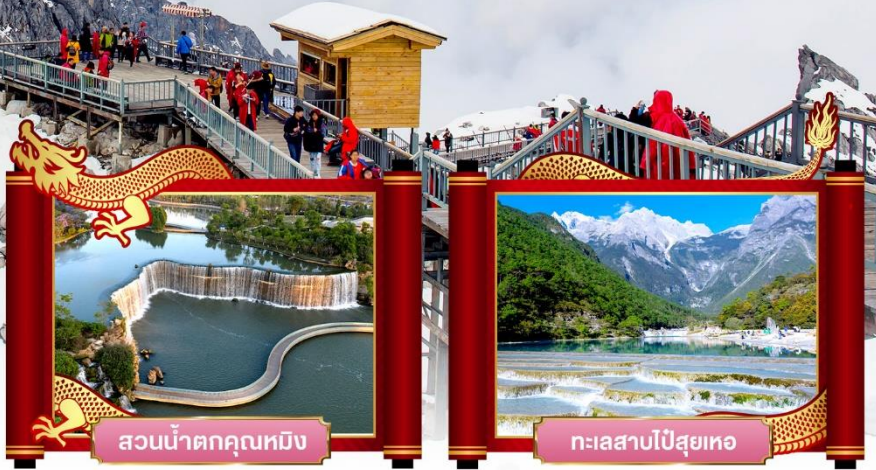
สวนน้ำตกคุนหมิง

✓ พิเศษ! โชว์จางอวิโหม่ว "ความประทับใจลี่เจียง"