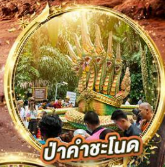
ปากคำชะโนด