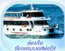
ล่องเรือ ช่องแคบบอสฟอรัส