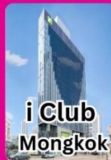
i Club Mongkok