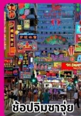
ช้อปปิ้งชาบู