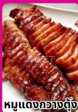
หมูแดงกวางตุ้ง