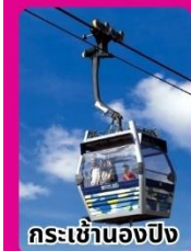
กระเช้าฮ่องกง