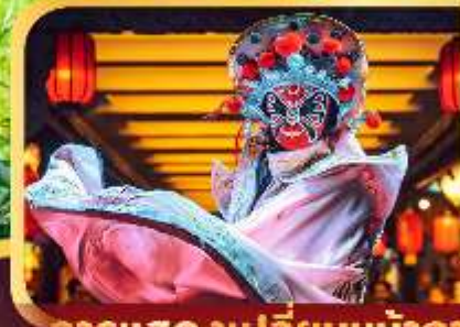
การแสดงเปลี่ยนหน้ากาก

WCN160611 6 วัน 5 คืน 3U บิน SICHUAN AIRLINES