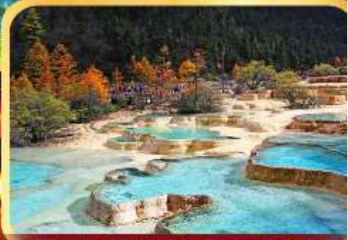
อุทยานหลวงหลงมรดกโลก