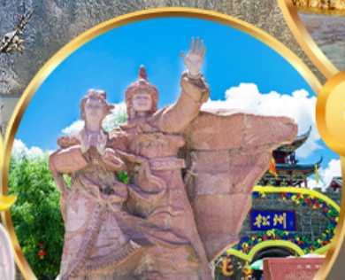
เมืองโบราณขงฟาน