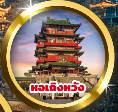
หอเถิงหวัง