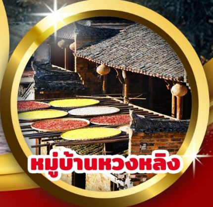
หมู่บ้านหวงหลิ่ง

มือพิเศษ!! บุปเฟตบิงย่าง + หม่าล่า + สุกี้หม่าล่า เปิดอย่างช่างเหรา