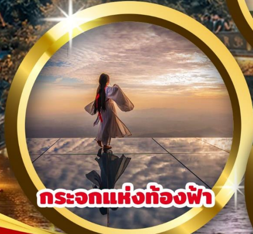
กระบอกแห่งท้องฟ้า