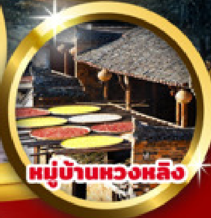
หมู่บ้านหวงหลิง

“อุ๋หมวน หมู่บ้านชนบทที่สวยงามที่สุดของจีน หวงหลิง หมู่บ้านโบราณยุคกลางอายุกว่า 580 ปี ภูเขาหลิงซาน สถานที่ศักดิ์สิทธิ์แห่งที่ 33 ของโลก หอเถิงหวัง หอโบราณที่มีชื่อเสียงแห่งเฉิงหนาน”