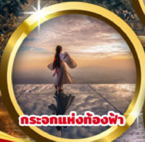
กระเอกแห่งท้องฟ้า