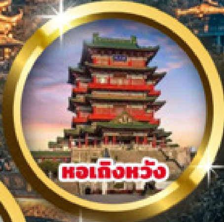
หอเถิงหวัง