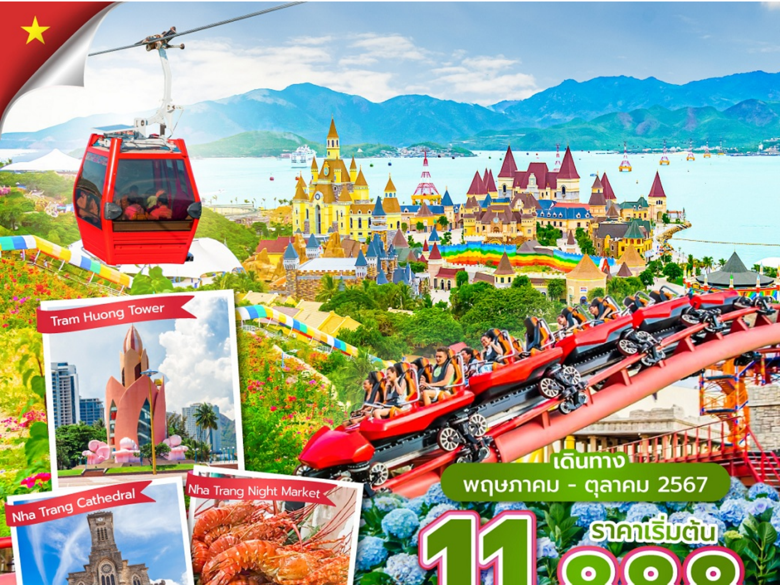
Tram Huong Tower