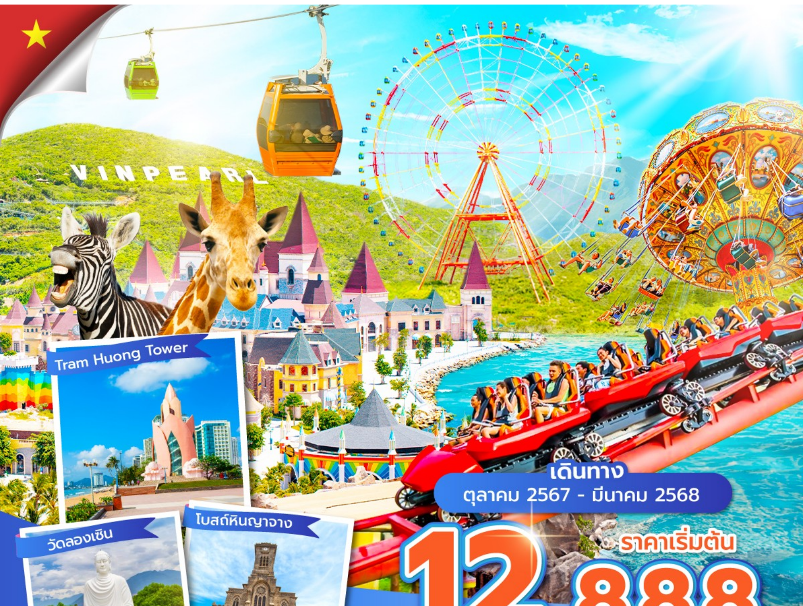
Tram Huong Tower