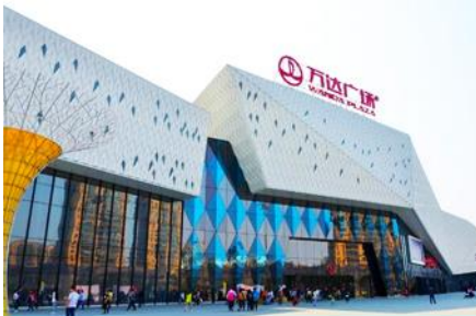
ห้างว่ันต้าสแควร์

พักที่ โรงแรม HARBIN REZEN HOTEL โรงแรมระดับ 4 ดาวท้องถิ่นหรือเทียบเท่าในเมืองฮาร์บิน