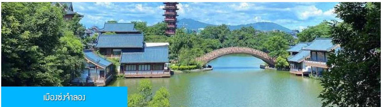
เมืองช่งจำลอง

พักที่ GUILIN JINYI HOLIDAY HOTEL โรงแรมระดับ 4 ดาวท้องถิ่น หรือเทียบเท่าในเมืองก๊วยหลิน