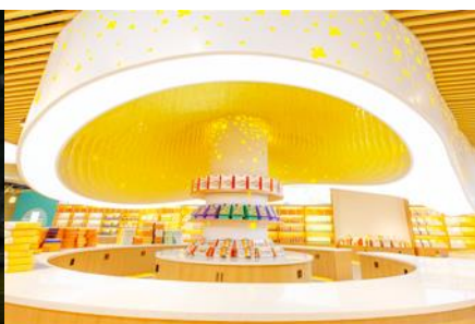
พิพิธภัณฑวัตถุกุ้ยฮวา