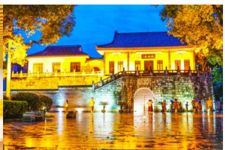
ประตูโบราณกุ๋หนานเหมิน