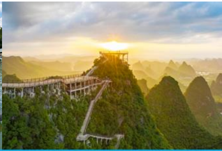
ภูเขาหฺรูยี่ฟง