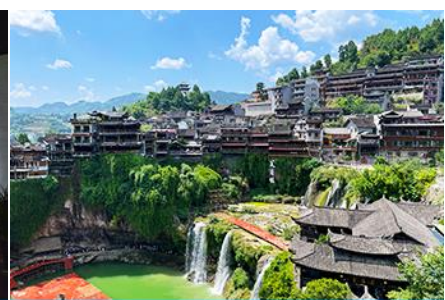
เมืองโบราณฝูหรงเจิน

วันที่สาม เมืองฉางเจียเจีย-ตึกมหิศวรรษย์ 72 ชั้น-พิพิธภัณฑ์ภาพหินทราย –ศูนย์แพทย์แผนจีน-เมืองโบราณฝูหรงเจินยามค่ำคืน