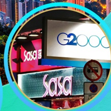
อิสระช้อปปิ้ง