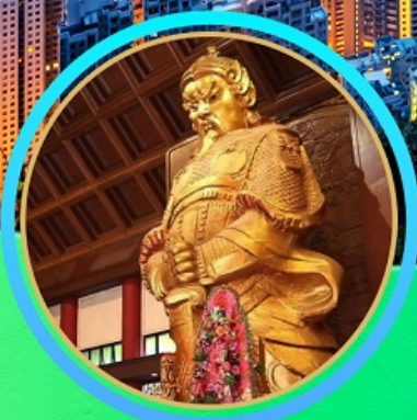
เจ้าพ่อแซกซง วัดกั๊งหัน