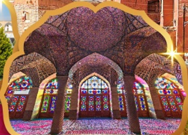
Nasir al Molk Mosque