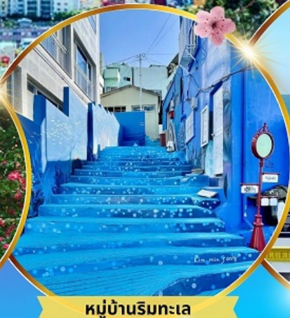
หมู่บ้านริมหทะเล