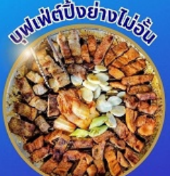
บุฟเฟ่ต์ปิ้งย่างไม่อั้น