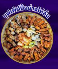
ขนมฟัดปังย่างโชรส