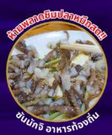
หอยหลอดซีสปลาหมึกทอด

ถ่ายรูปชิคๆ หมู่บ้านวัฒนธรรมคิมซอน เชคอิน คาเฟ่ริมทะเล วิวหลักล้าน ขึ้นเคเบิลคาร์ ชมทะเลปูซาน นั่งรถไฟปู๊กบิก sky capsule ห้ามพลาด!! ตลาดปลาที่ใหญ่ที่สุด ชิมของอร่อยที่ตลาดแฮจุนแด อิสระช้อปปิ้ง Lotte Duty Free