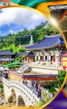
วัดแสดงยงกุงซา