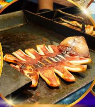
ตลาดแฮจุนแด