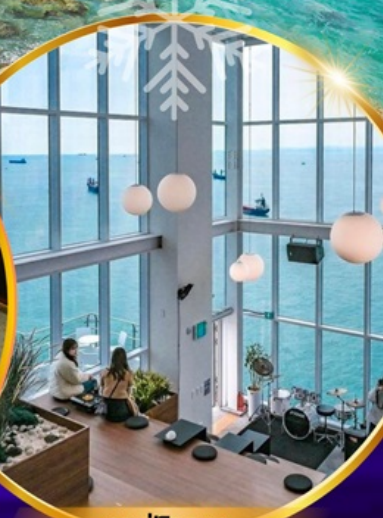
คาเฟ่วิวทะเล

ถ่ายรูปชิคๆ หมู่บ้านวัฒนธรรมคัมซอน เชคอิน คาเฟ่ริมทะเล วิวหลักล้าน ขึ้นเคเบิลคาร์ ชมทะเลปูซาน นั่งรถไฟปิ๊กปิ๊ก sky capsule ห้ามพลาด!! ตลาดปลาที่ใหญ่ที่สุด ชิมของอร่อยที่ตลาดแฮอนแด อิสระช้อปปิ้ง Lotte Duty Free