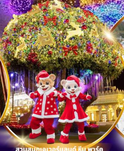
สวนสนุกเอเวอร์แลนด์ ฮิม พาร์ค