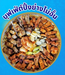
บุฟเฟ่ต์ปิ้งย่างไม่วัน