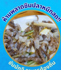
จินปักจิ อาหารท้องถิ่น

โพฮังสเปซวอล์ก สกายวอร์ค ตามรอยซีรีส์ Hometown chachacha ถ่ายรูปชิคๆ หมู่บ้านวัฒนธรรมคัมชอน ขึ้นเคเบิลคาร์ ชมทะเลปูซาน นั่งรถไฟปู๊กปิก sky capsule ชิมของอร่อยตลาดแฮอุนแด อิสระช้อปปิ้ง Lotte Duty Free