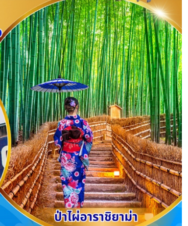
ป่าไฟอาราชิยาม่า