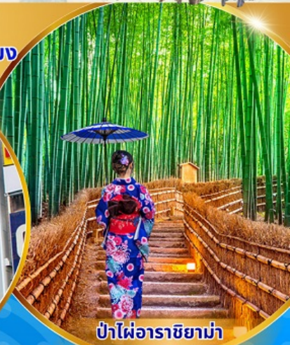
ป่าไฟอาราชิยาม่า