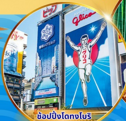
ซูปป์ริงโดทงโยริ