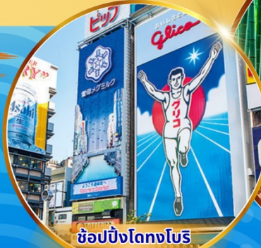
ซูปป์ริงโดทงโบรี