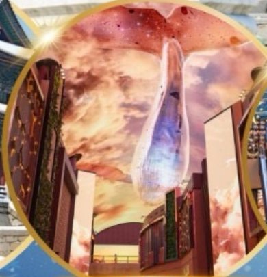
INSPIRE Entertainment Resort