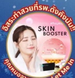
อิสระ-ทำสวยที่รพ.ดังคั้งนับ!!! บริการอาหารรายการ Let Me In

ชมจอ LED ขนาดยักษ์ที่รีสอร์ท 5 ดาว สักการะวัดจอนดงซา วัดโบมุนซา วัดชุกุกชาวัดทองที่ใหญ่ที่สุดในเอเชีย วัดซัมซอนซา วัดพงอินซา พระพุทธรูปขนาดใหญ่ของโซล ชมพระราชวังคยองบกุง ห้องสมุดสุดอลังการ อิสระ-ช้อปปิ้ง Lotte Duty Free