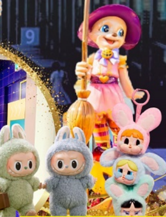
ชม Art toy ห้างปลอด ตามล่าหา Labubu กับ PPG ที่โซล