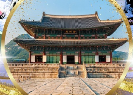
พระราชวังเคียงบกกรุง