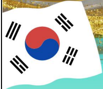
ตลาดกว้างจัง