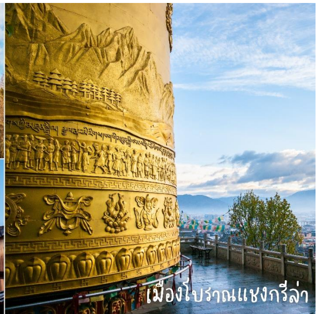
เมืองโบราณแชงกรีล่า