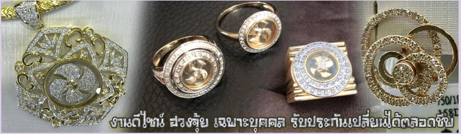
งานตีทอง สวยหรู เฉพาะบุคคล รับประกันเปลี่ยนไม่ตัดลดชิ้น

เที่ยง รับประทานอาหารกลางวัน ณ กัณฑ์ดาตาร ***เมนูท่านอย่างฮ่องกงแสนอร่อย***